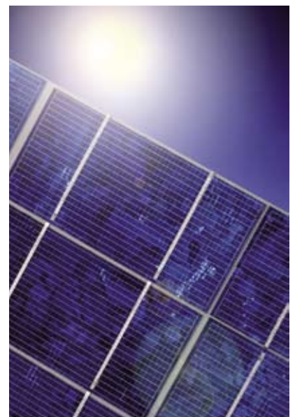
Planibel Clearvision, perfect voor zonnetoepassingen