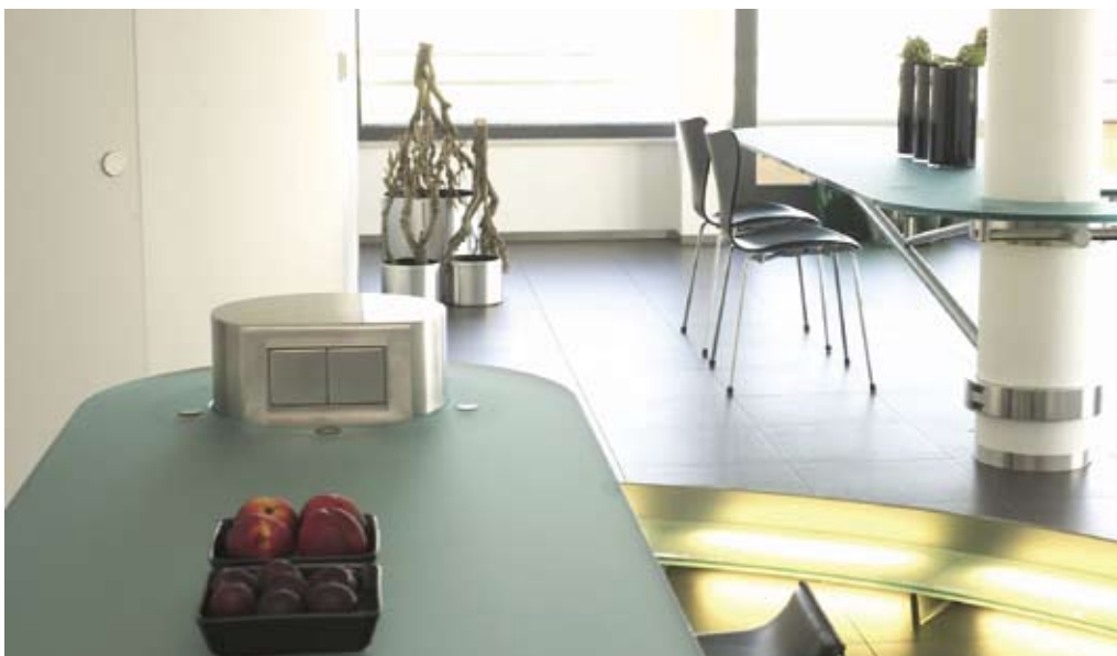
Planibel Linea Azzurra in gesatineerde Matelux versie

Planibel Clearvision is een ideaal product voor toepassingen waarbij de zon een rol speelt: fotovoltaïsche zonnepanelen, warmtepanelen en zonnespiegels. Het biedt een buitengewoon hoge energietransmissie en een excellente transmissie in het actieve spectrum van zonnepanelen. Dit maakt van Planibel Clearvision de beste keuze om de efficiëntie van uw zonne-energiesystemen te optimaliseren. Gedetailleerde technische informatie over de zonne-eigenschappen van Planibel Clearvision is op verzoek verkrijgbaar.